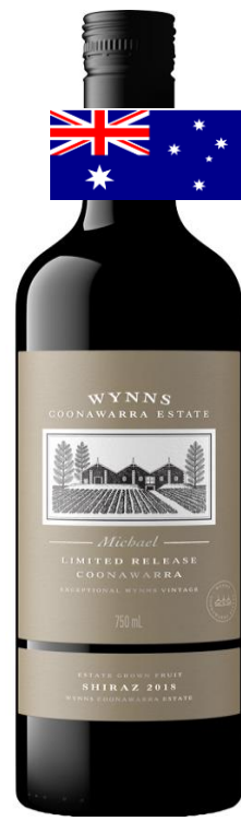
Wynn's Michael 2018