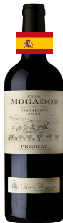
Clos Mogador 2020