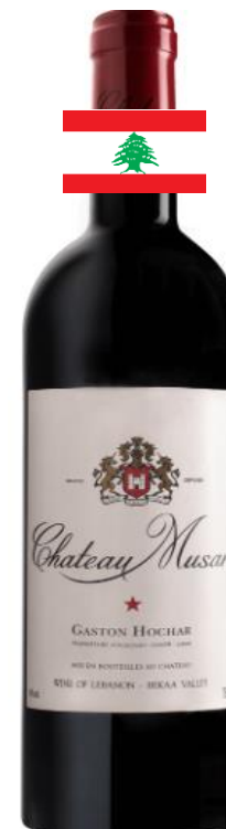
Chateau Musar 2017