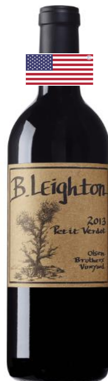
B. Leighton Petit Verdot 2012