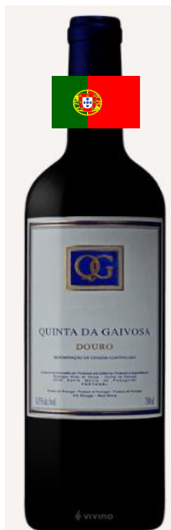
Quinta da Gaivosa 2013